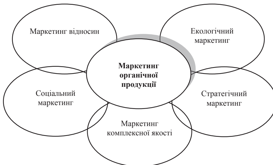
Рис. 1. Зв'язки маркетингу органічної агропродовольчої продукції з іншими концепціями маркетингу

Джерело: Побудовано авторами на основі наукових узагальнень.