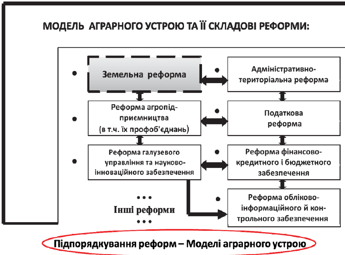
Рис. 1. Визначальність моделі аграрного устрою в аграрній політиці