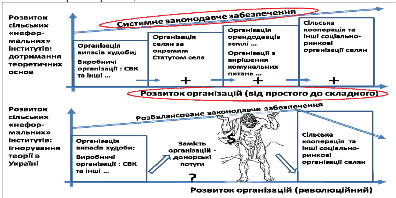
Рис. 3. Основа реалізації моделі: забезпечення проактивності селян через розвиток їх організацій

льного проживання. В нашому випадку – проживання в одному селі. Дієвість організації (в т.ч. й у зміні психотипу) прямо співвідноситься з факторами власності, управління та контролю. Зрозуміло, що за цими факторами сільську територіальну громаду варто формалізувати на кшталт міського ОСББ. На наше переконання, як колишні колгоспи, так і сільські територіальні громади, що асоціюються з відповідними Радами як організації, заангажовано сприймаються нашим селянством. Історична пам'ять суттєво впливає на психотип. До активної участі в тому чи іншому статусі старої чи нової організації психотипам, так би мовити, слід бути готовими.