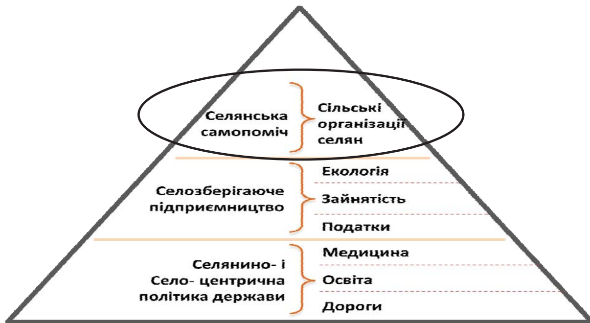
Рис. 4. Головні складові та пріоритети Моделі розвитку сільських територій

туційних особливостей Моделі розвитку сільських територій. Одну, єдину й бажану для нас усіх Моделі. Можна дискутувати про особливості такої Моделі в регіонах України, але досвід Польщі чи Білорусі орієнтує нас на вибір саме однієї Моделі. При цьому не так важливо, чи маємо ми щось запозичити із Моделей сусідніх країн, чи ні. Важливо інше – ці та інші успішні у сільському розвитку країни свого часу визначилися з бажаною для них Моделлю, саме виходячи зі стану й можливостей змін неформальних інститутів їхнього селянства. Визначилися і сконцентрували всі наявні можливості, зусилля усіх відповідних державних, наукових та громадських інституцій на реалізації однієї Моделі. На наш погляд, саме в такому підході й полягав стрижень успіху наших сусідів.