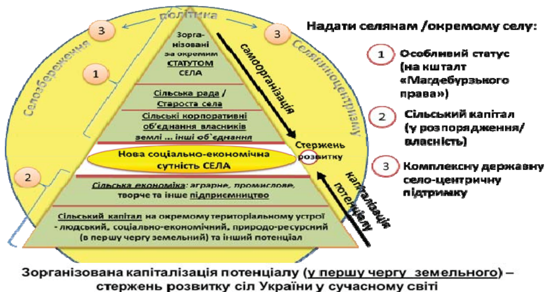
Рис. 6. Селозберігаюча модель аграрного устрою України: базовість самоорганізації і самодостатності сіл

На рисунку 6 візуалізовано три головні складові реалізації Моделі.