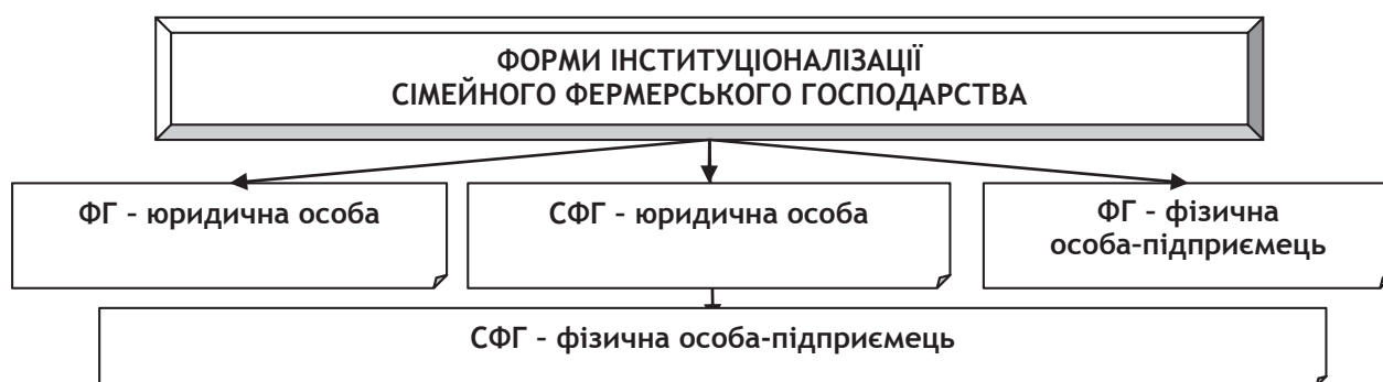
Рис. 1. Форми розвитку сімейного фермерства

Відповідно до правової формалізації в ринковому механізмі господарювання на сьогодні виокремлюється чотири форми інституціоналізації фермерського господарства (рис. 1).