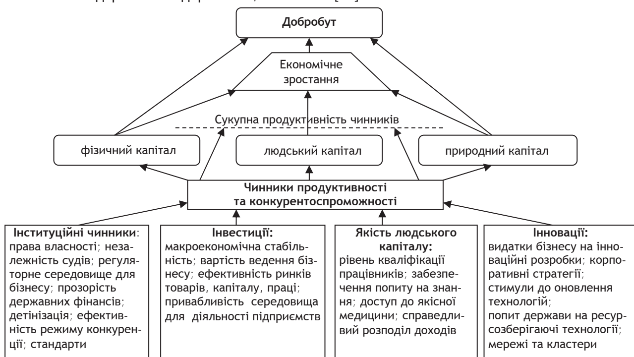
Рис. 2. Модель економічного зростання через взаємозв'язок між чинниками продуктивності, конкурентоспроможності

Ряд учених-аграрників під поняттям конкурентоспроможності аграрних підприємств розуміють здатність суб'єктів економічної діяльності аграрної сфери пристосовуватися до нових умов господарювання, використовувати свої конкурентні переваги і перемагати в конкурентній боротьбі на ринках сільськогосподарської продукції/послуг та засобів виробництва, максимально ефективно використовувати земельні ресурси, якомога повніше задовольняти потреби покупця шляхом аналізу структури ринку і гнучкості реагування на зміну його кон'юнктури [12].