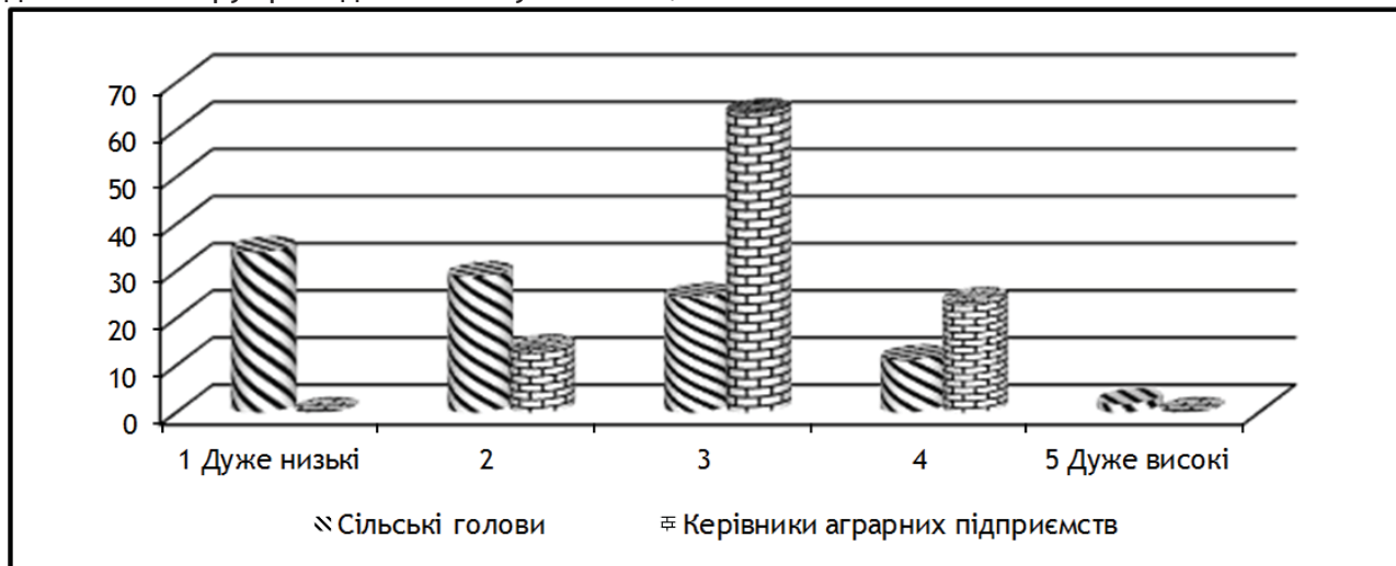
Рис. 1. Рейтингова оцінка рівня розвитку соціальної відповідальності агробізнесу в Житомирській області, %

на засадах втілення кращих ідей соціальної відповідальності тощо.