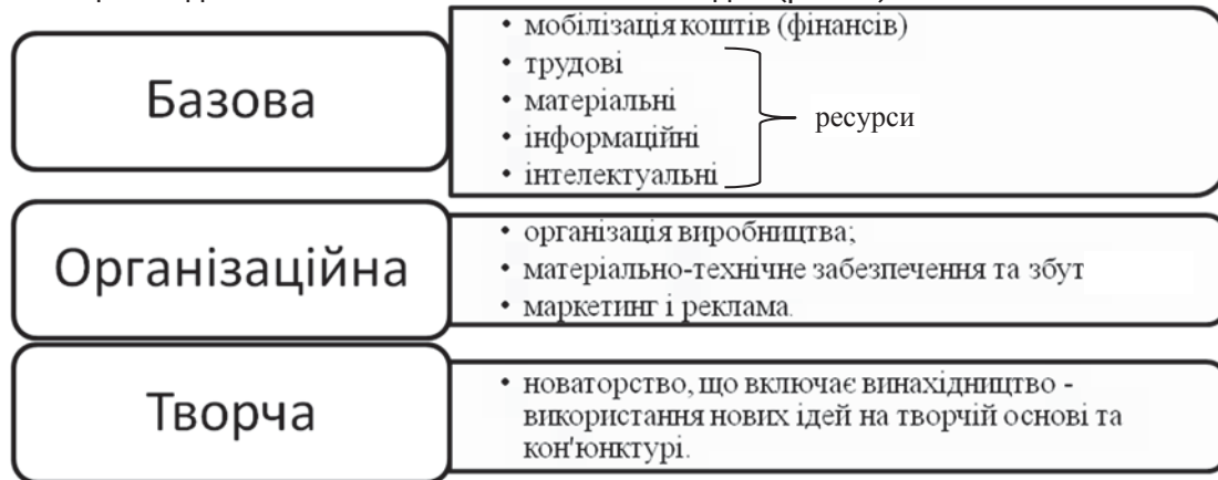
Рис. 1. Основи підприємницької діяльності за С. В. Мочерним

С. В. Мочерний [18], підприємництво ґрунтується на базовій, організаційній і творчій засадах (рис. 1).