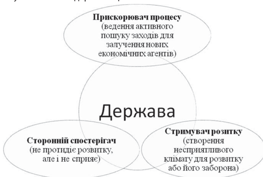
Рис. 3. Роль держави як регулятора підприємницького процесу

Вважаємо за необхідне зазначити і роль держави у контексті регулювання процесу підприємництва, яку, залежно від конкретної ситуації, можна розглядати як прискорювача підприємницького процесу та його стороннього спостерігача, так і стримувача розвитку підприємництва (рис. 3) [5].