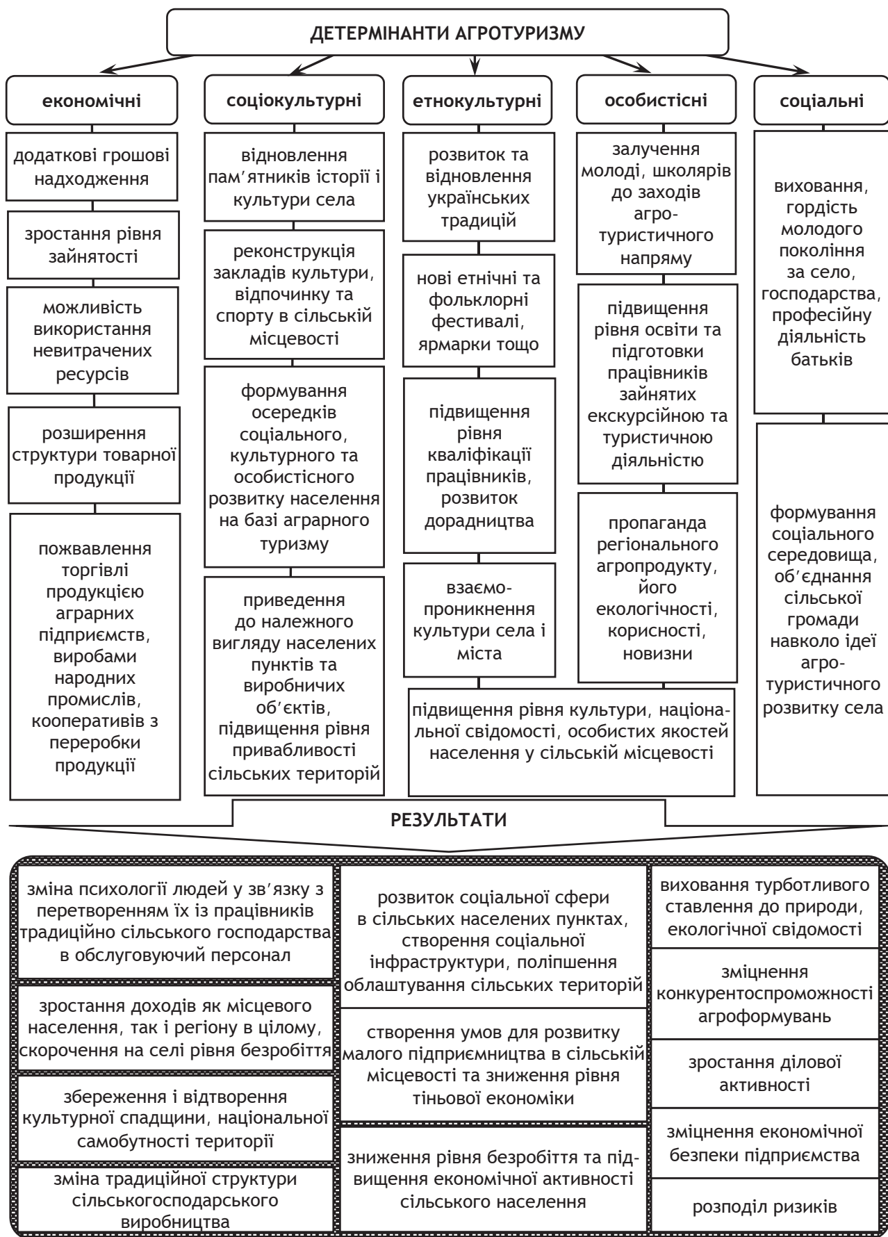
Рис. 1. Соціально-економічні детермінанти розвитку агротуризму