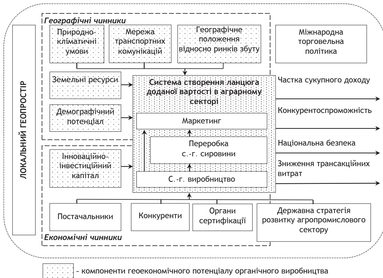
Рис. 2. Структурна модель функціонування аграрної геоелекономічної системи

елекономічні системи представлено у вигляді функціональної моделі, у якій відображено вхідні та вихідні сигнали, складові таких систем, елементи їх зовнішнього середовища, інструменти та механізми регулювання процесом їх функціонування (рис. 2).