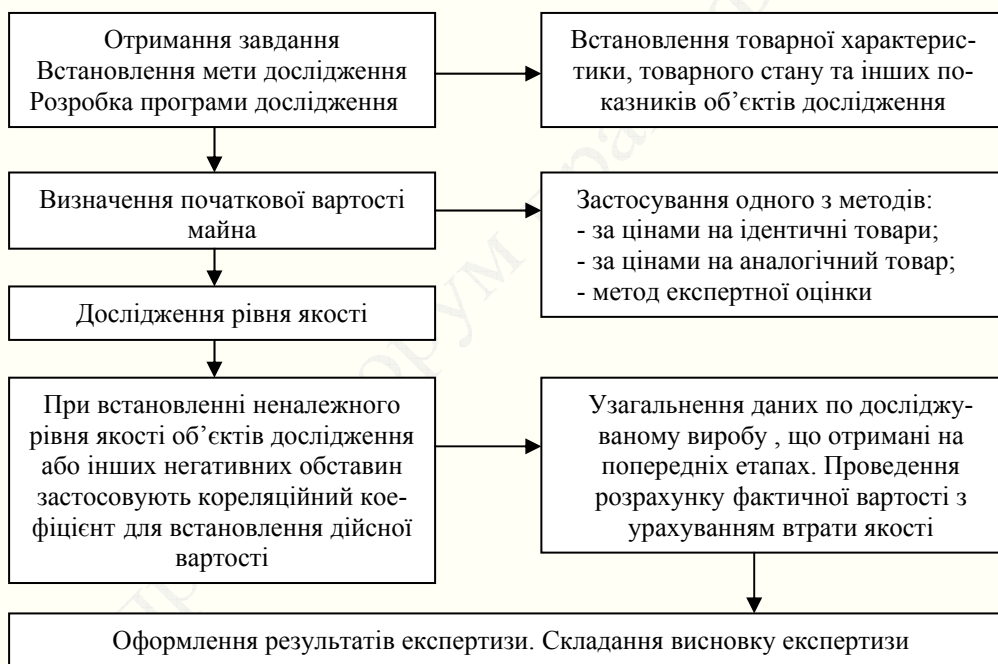
Рисунок 2 - Алгоритм рішення завдання по оцінці конфіскованого та іншого майна, що переходять у власність держави

На підставі цієї схеми був розроблений алгоритм проведення оцінки конфіскованого та іншого майна, що переходить у власність держави, та який рекомендується застосовувати в експертній практиці (рис.2).