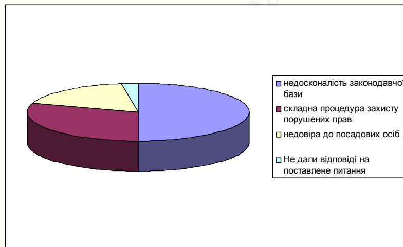
Рисунок 3 - Розподіл відповідей пересічних громадян

Не змогли дати однозначної відповіді на поставлене питання тільки 5 респондентів (2,5 %).