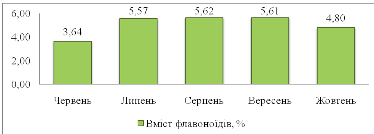
Рис. 2. Вміст флавоноїдів (%) у рослинній сировині чорнобривців прямоствоячих високорослої форми сорту «Гаваї» у залежності від термінів збирання сировини