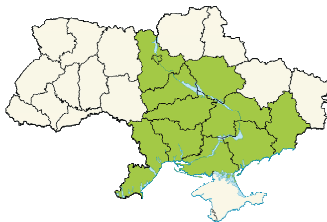
Рис. 2. Поширення Phlomis pungens Willd. на території України

В Україні зустрічається (рис. 2) у степах, степових схилах та кам'янистих відслоненнях переважно в степовій частині, рідше в південному лісостепу (Київська, Полтавська, Запорізька, Донецька області тощо) [2].