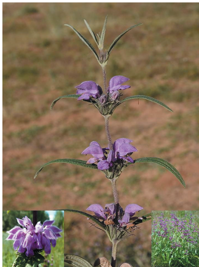
Рис. 1. Phlomis pungens Willd.

медицині інших країн, зокрема, етномедициною Сирії Phlomis pungens застосовується для лікування болів у шлунку, застуди, грипу, закріпів та для підвищення апетиту [7]. Народною медициною Туреччини – для лікування кашлю, а також у ветеринарній медицині для лікування діареї [8]. Східнослов'янські народи використовували сировину Phlomis pungens для лікування інфекцій сечостатевої системи, виразки шлунка, хронічних гастритів, пневмонії, бронхіту, респіраторних інфекцій, анемії, гіпертонії, астенії, гнійних ран, геморою та набряків [9].