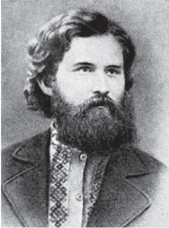
В. Г. Короленко (фото 1880 р.)

чином проаналізовані та інтерпретовані провідними політичними, громадськими, культурними діячами. Одним з таких діячів, які переважно більшість свого життя займалися трактуванням моральних цінностей, був видатний письменник-гуманіст, правозахисник та громадянський діяч Володимир Галактіонович Короленко, якого в російській критичній літературі кінця XIX – початку XX ст. нерідко називали апостолом «вселюдської любові», сентиментальним співаком жалісності і «загального примирення».