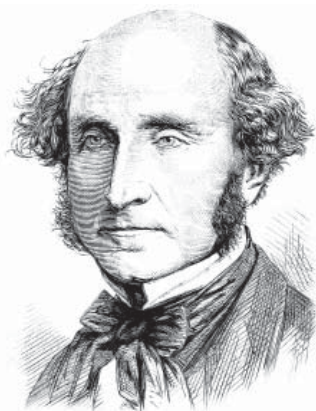
Портрет британського філософа і політичного діяча Джона Стюарта Мілля

Аналізуючи дану моральну систему, В. Короленко зазначає: «Під утилітаризмом я розумів дійсно утилітаризм Мілля і саме його положення: «найбільше щастя найбільшій кількості людей» – ось що має служити моральним стимулом людських прагнень. Теорію егоїзму я теж вважаю загальнофілософською, або, якщо хочете, психологічною, взагалі абстрактним науковим додатком до утилітаризму, додатком, з яким я зовсім уже не згоден» [5]. Тобто, порівняно з «моральною системою» Ж.-М. Гюйо, який провідними вважав індивідуалістичні ціннісні орієнтації (прагнення досягнення найкращого результату діяльності лише для себе, що супроводжується повною байдужістю до результатів іншої людини (максимум для себе), В. Короленко значно кращим вважав утилітаризм Дж. С. Мілля, у вченні якого провідними були про соціальні ціннісні орієнтації (прагнення особистості