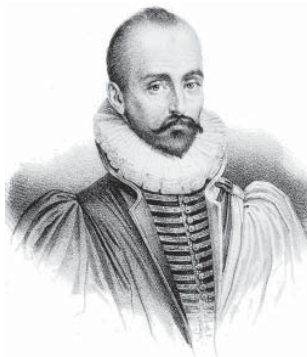
Портрет французького письменника і філософа епохи Відродження Мішеля де Монтеня

не буде ні щастя, ні душевного спокою. Він осаджує на кожному кроці людську пиху, доводячи, що людина не може пізнати абсолютної істини, що всі істини, визнані нами абсолютними, не більше як істини відносні.