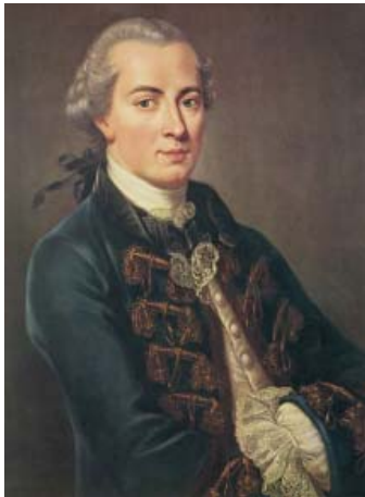
Портрет німецького філософа, засновника Німецької класичної філософії Іммануїла Канта

І В. Короленко, і Дж. С. Мілль не пояснили механізму вирішення зазначеного конфлікту, однак, за їх логікою, моральний вибір та оцінка повинні здійснюватися за допомогою визначення якнайкращих задовольень з точки зору принципу користі.