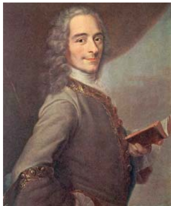
Портрет французького філософа-просвітника XVIII ст. Франсуа-Марі Аруе (Вольтера)

В. Дорошевич, зауважує: «тільки-но Вольтер дізнався, що нецтво й нетерпимість принесли людську жертву, він не міг працювати, зазначаючи, що не міг повернутися до роботи й знову став знаходити в житті радість тільки тоді, коли після героїчної боротьби з його боку нецтво й нетерпимість були осоромлені, а нещасний страчений Калас