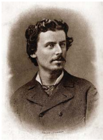
Портрет французького філософа Жана-Марі Гюйо

Жан-Марі Гюйо був досить популярним у середовищі російської інтелігенції наприкінці XIX – на початку XX ст.; його ідеї цікавили