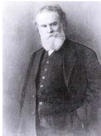
В. Г. Короленко (фото 1910 р.)

Вимога дотримання прав людей конкретизується Дж. С. Міллем у вченні про справедливість. Справедливість, вважає він, полягає в збереженні status quo (існуючого стану речей). Зі справедливістю, як однією з головних про соціальних ціннісних орієнтацій, пов'язані вимоги – подяки: на добро усім відповідай добром; відплати (або покарання): всім віддавай