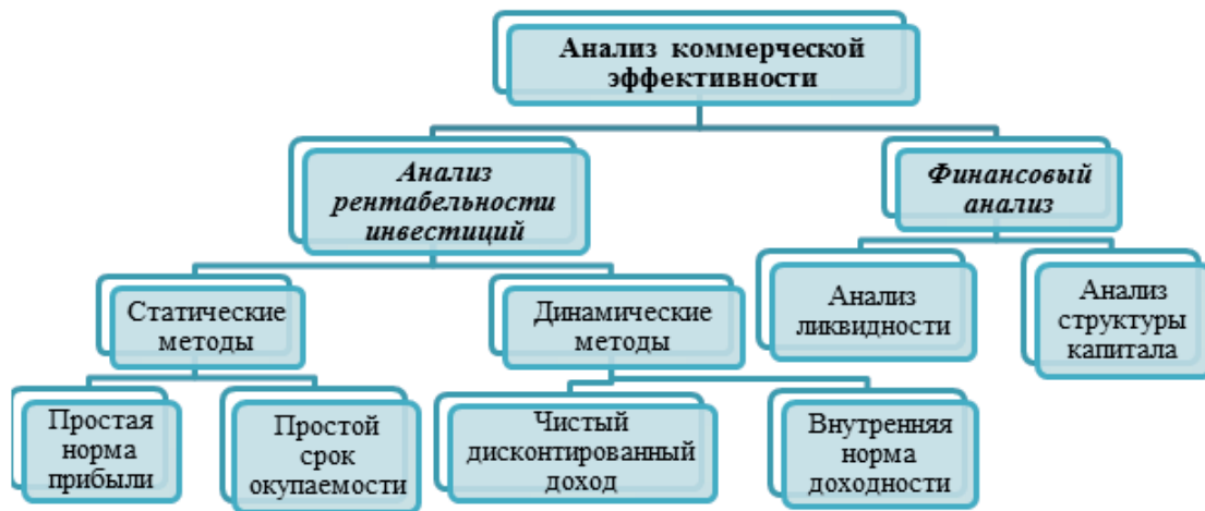
Рис. 2. Структура анализа коммерческой эффективности в соответствии с Руководством UNIDO

В соответствии с Руководством «анализ коммерческой эффективности – это первый шаг в экономической оценке проекта. Он связан с оценкой возможности реализации нового проекта с точки зрения его финансовых результатов. Прямые доходы и затраты проекта, таким образом, рассчитываются в денежном (стоимостном) выражении по преобладающим (ожидаемым) рыночным ценам» [4, с. 37]. Данный вид анализа используется для оценки надежности и приемлемости как одного проекта, так и ряда проектов с целью их ранжирования исходя из доходности. Анализ коммерческой эффективности состоит из анализа рентабельности инвестиций и финансового анализа.