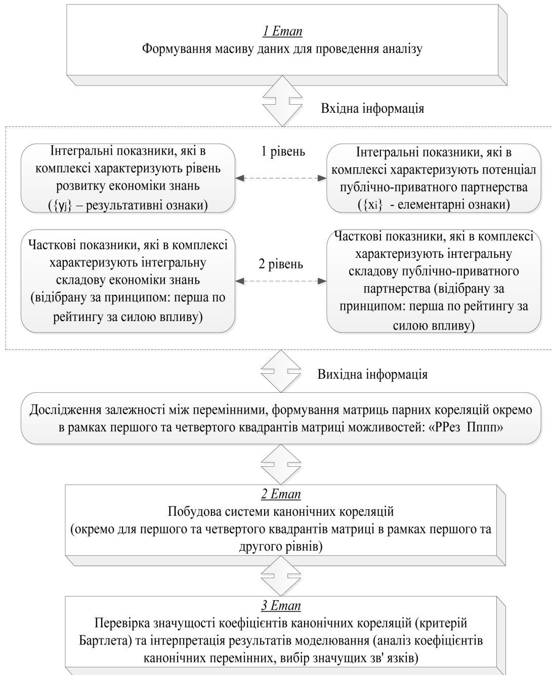
Рис. 3. Послідовність виявлення зв'язків між інтегральними і частковими показниками економіки знань та потенціалу ППП