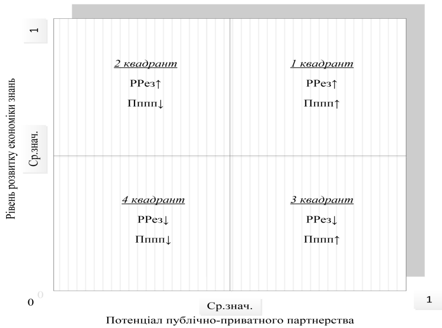
Рис. 2. Площина можливостей: «RRez-Пппп»