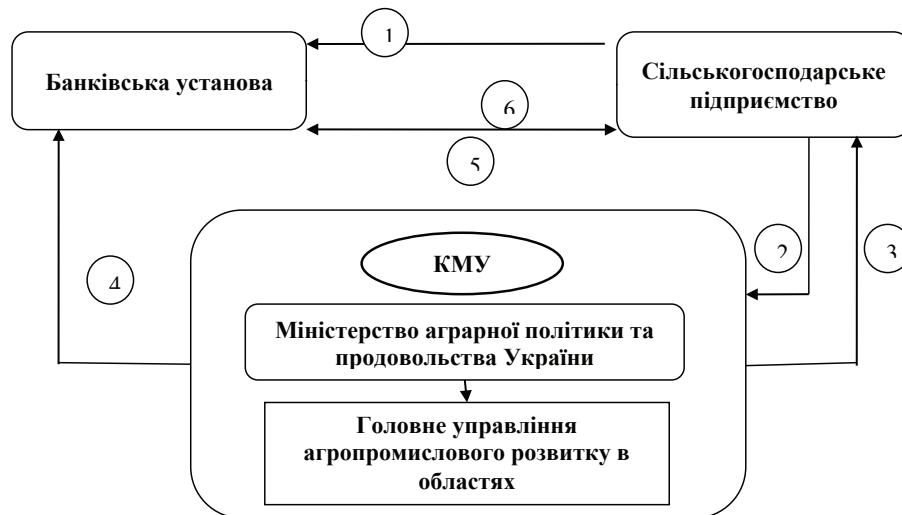
Рис. 3 Механізм надання державної гарантії при кредитуванні сільськогосподарських підприємств