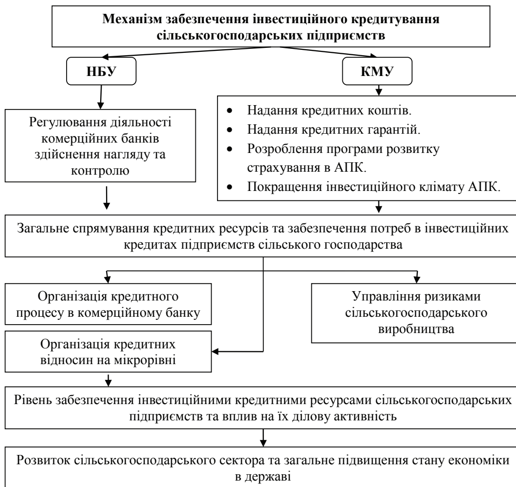
Рис. 4. Орієнтована схема реалізації механізму покращення інвестиційного кредитування сільськогосподарських підприємств