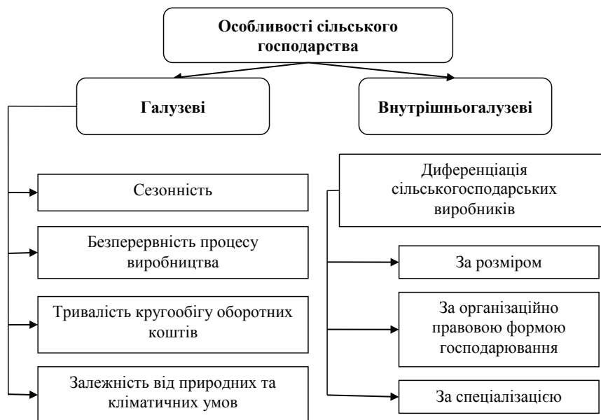
Рис. 1. Особливості організації сільськогосподарського виробництва

Специфіка кредитування сільськогосподарських підприємств, яка знаходиться в безпосередньому зв'язку з галузевими та внутрішньогалузевими особливостями організації самого сільського господарства представлена на рис. 1.