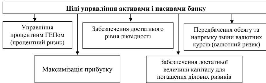
Рис. 1. Цілі управління активами і пасивами банку

Таким чином, ключовими моментами, які вимагають прийняття рішень у процесі управління активами і пасивами є ліквідність, чутливість процентних ставок та ціноутворення для максимізації прибутку. Всі ці аспекти взаємопов'язані.