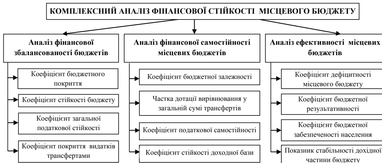
Рис. 1. Напрями та система показників комплексного аналізу фінансової стійкості місцевого бюджету