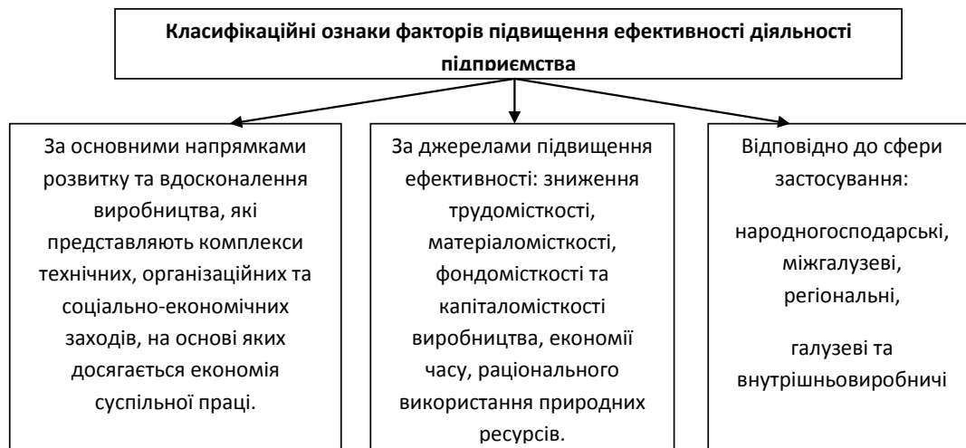
Рис. 2. Класифікаційні ознаки факторів підвищення ефективності діяльності підприємства*

підвищення ефективності роботи підприємства на інноваційних засадах полягають в підвищенні його технічного рівня, вдосконалення управління, формування належного рівня інформаційного забезпечення досліджень і розробок, налагодження електронних комунікацій, активізація винахідницько-раціоналізаторської роботи на підприємстві тощо.