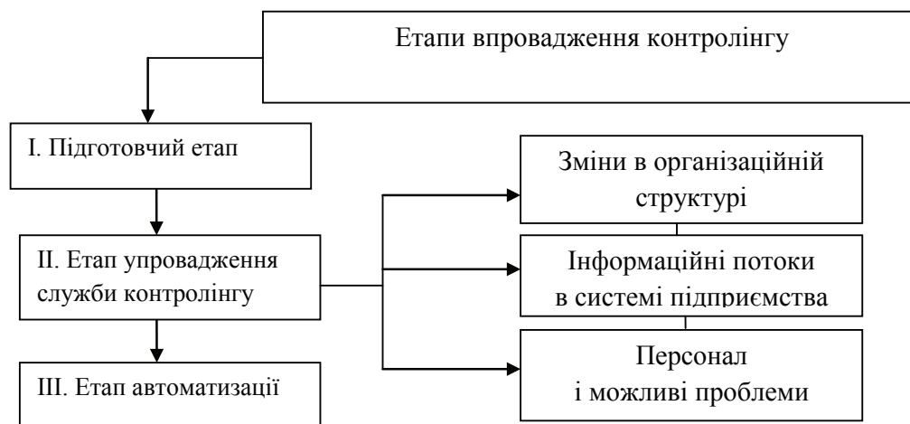
Рис. 1. Етапи впровадження контролінгу на підприємстві

Упровадження контролінгу на підприємстві може відбуватись у трьох напрямках (рис. 1).