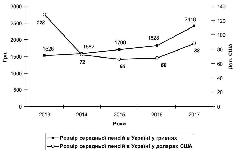
Рис. 2. Динаміка показників середньої пенсії в Україні у 2013—2017 рр. (на кінець року)