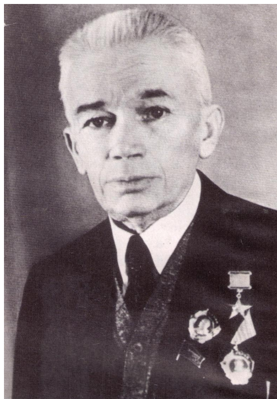
Александр Александрович Богомолец – Президент Академии наук УССР