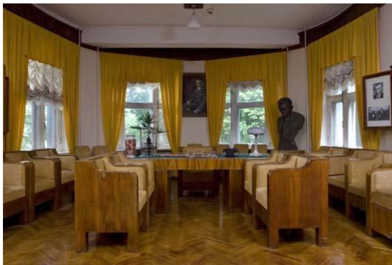
Кабинет-музей Александра Александровича Богомольца в Институте физиологии им. А.А. Богомольца НАН Украины