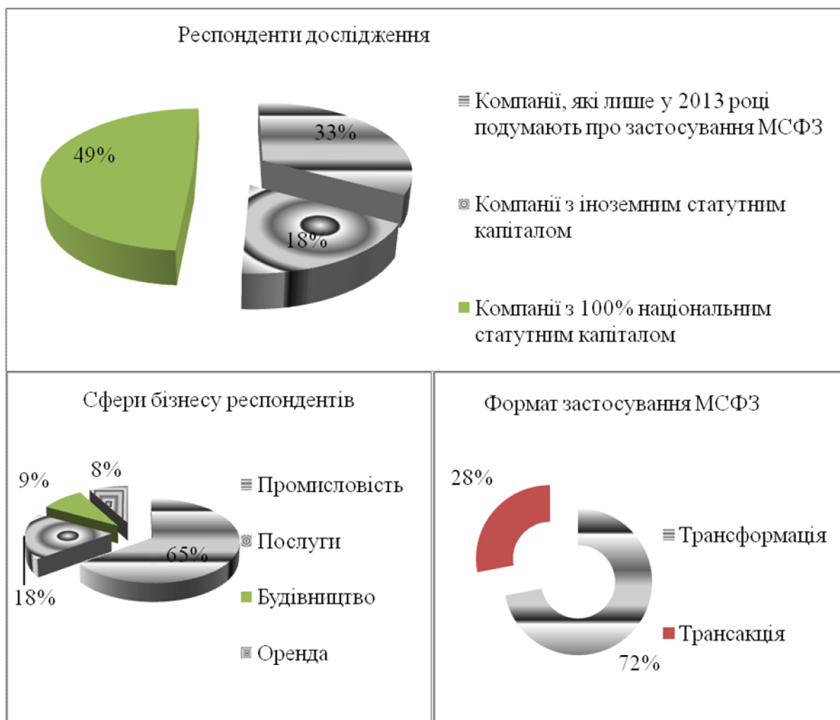
Рис. 2. Результати впровадження Міжнародних стандартів фінансової звітності в Україні

Таким чином, на сьогодні не можна стверджувати, що Міжнародні стандарти фінансової звітності фактично імплементовано в Україні. Існує великий ризик того, що більшість фінансової звітності вітчизняних підприємств може бути недостовірною та некоректною.