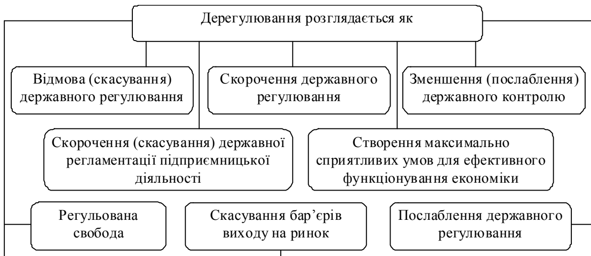
Рис. 1. Різні підходи до розуміння терміну «дерегулювання» (авторська розробка)

Різноманітність визначень поняття «дерегулювання» свідчить про складність предмета дослідження та дає змогу зробити наступні висновки: