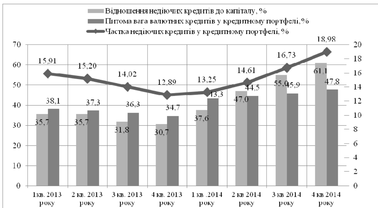
Рис. 2. Оцінні індикатори якості кредитного портфелю та кредитних ризиків банківської системи України протягом 2013-2014 років, %

Джерело: побудовано автором на основі даних [7]