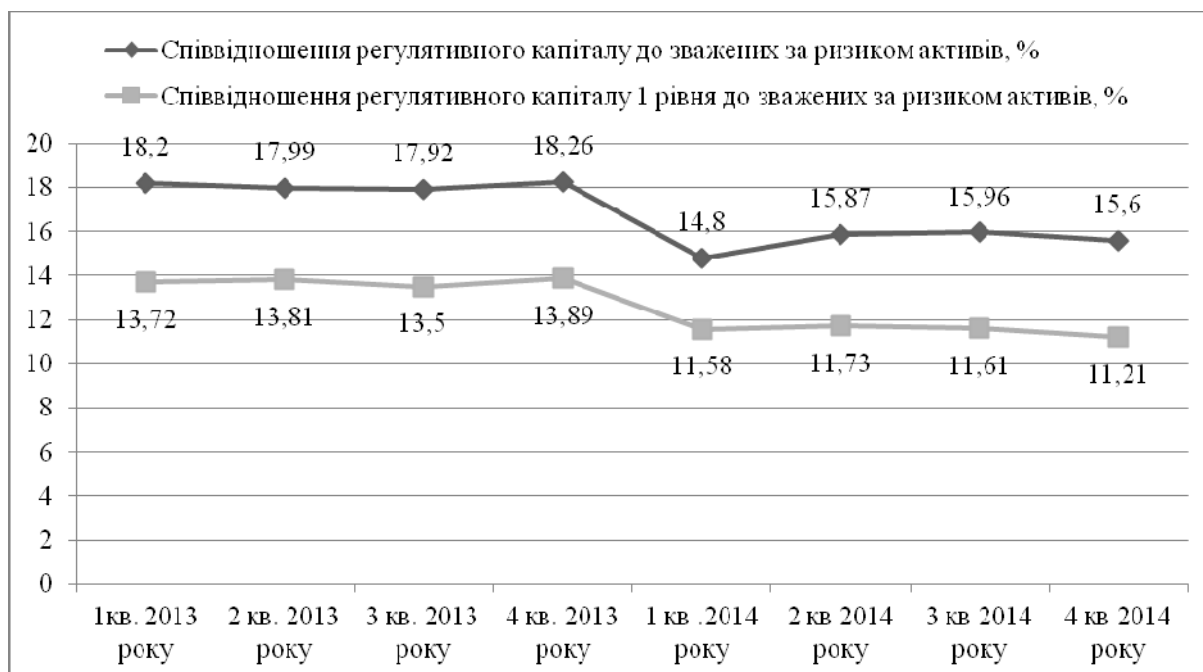
Рис 1. Динаміка індикаторів капітальної фінансової стійкості банківської системи України протягом 2013-2014 років, %

Окрім недостатнього потенціалу банківської системи для здійснення активних операцій, вагомую проблемою на даний момент є зниження запасу надійності по достатності власного капіталу: протягом року відношення регулятивного капіталу до зважених за ризиками активів зменшилось із 18,26% до 15,6%, у тому числі для регулятивного капіталу 1-го рівня – із 13,89% до 11,21% (рис 1)