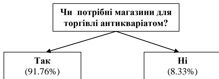
Рис.2. Необхідність антикварних магазинів, ((у %), авторське дослідження)

Наступне питання стосувалось доцільності використання магазинів для торгівлі предметами антикваріату в Україні. За даними опитування 91.76% вважали функціонування таких магазинів необхідним, і тільки 8.33% не бачили у них потреби (рис. 2).