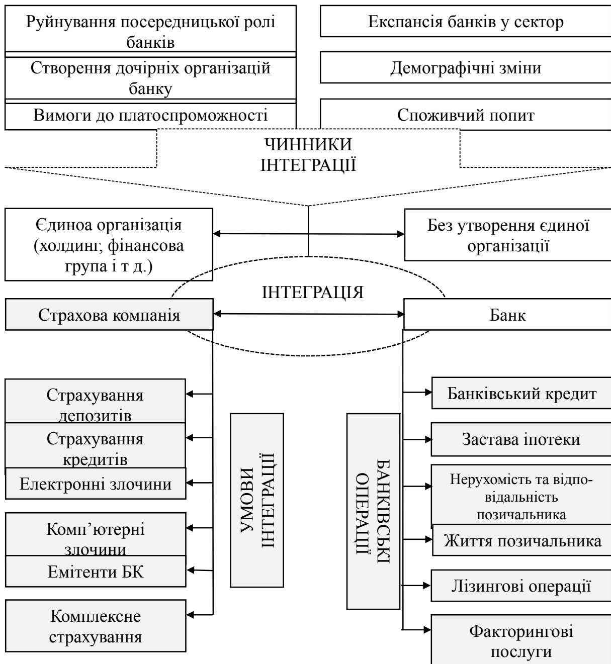
Рис.2. Процес інтеграції банків та страхових компаній