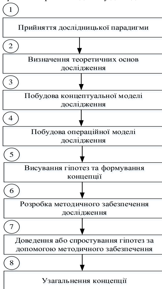
Рис. 1. Структурно-логічна схема наукового дослідження

В рамках як прийнятої парадигми, так і інших існують безліч теорій. Необхідно визначити, на які теорії потрібно спиратися в даному дослідженні.