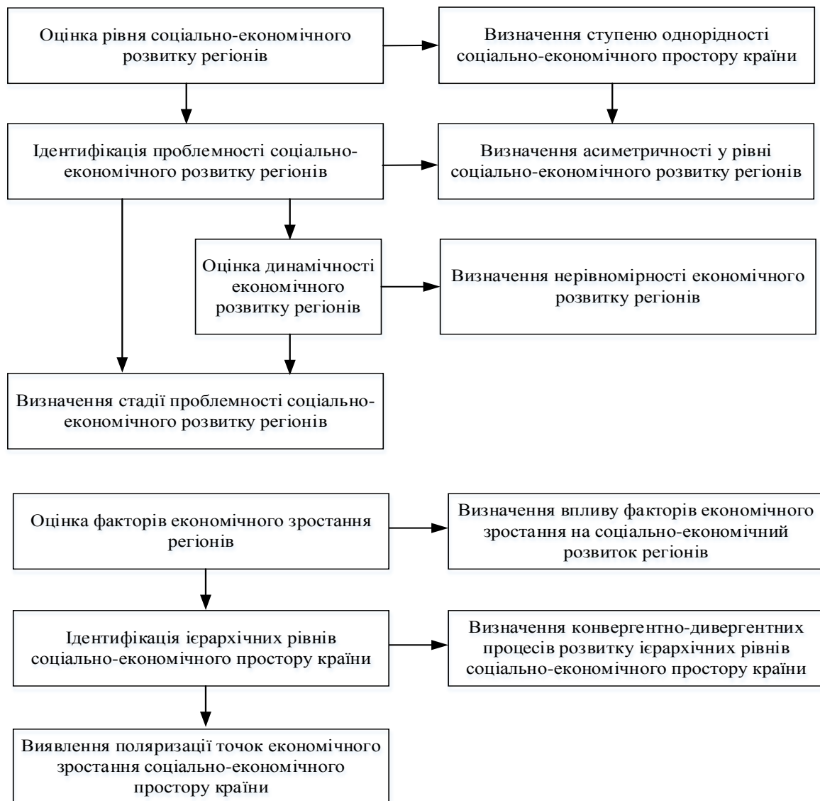
Рис. 3 Операційна модель дослідження диференціації соціально-економічного простору країни

Операційна модель дослідження є підґрунтям висування гіпотез і їх узагальнення, що передбачає четвертий етап.