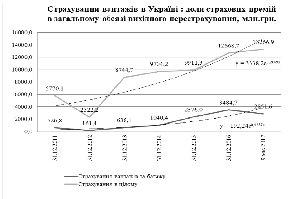
Рис. 4. Страховання вантажів в Україні: доля страхових премій в загальному обсязі вихідного перестраховання, млн грн.

Побудовані в результаті такого дослідження експоненційні трендові лінії свідчать про можливість прогнозувати подальшу позитивну динаміку щодо страхових премій у вітчизняному секторі перестраховання як для страхування вантажів так і в цілому для страхового ринку. При цьому, якщо для ринку перестраховання притаманною є певною мірою «стрибкуватість», то для долі страхових премій у перестрахованні вантажів спостерігається стабільна позитивна динаміка.