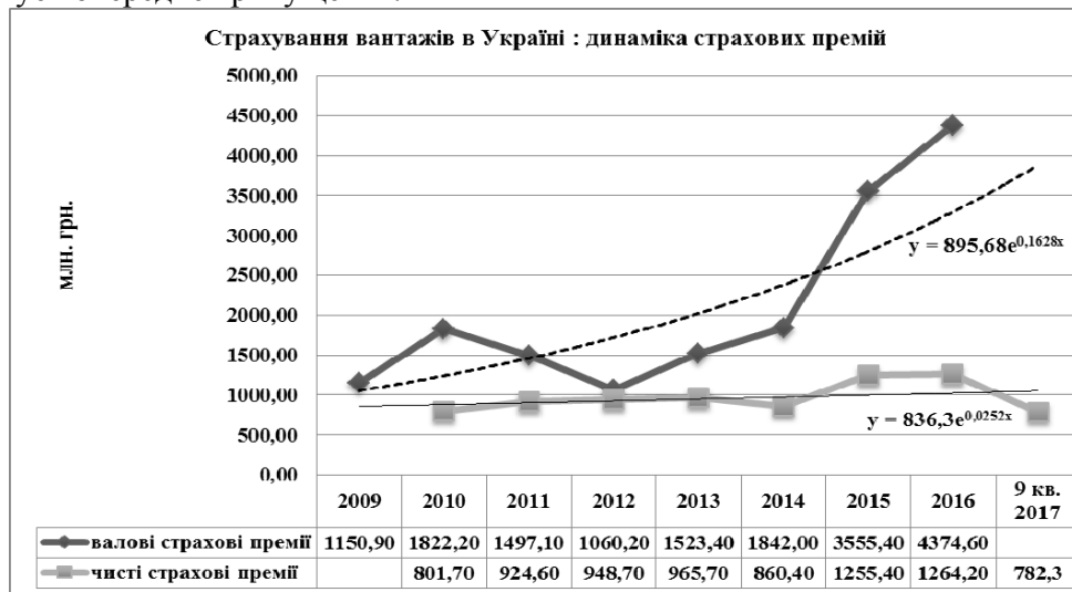
Рис. 3. Динаміка валових та чистих страхових премій за страхуванням вантажів в Україні за 2009 р. – 9 кв. 2017 р.: ретроспектива та тренд

Подальший аналіз динаміки валових та чистих страхових премій за страхуванням вантажів за 2009 р. – 9 кв. 2017 р., результати якого графічно представлено на рис. 3, підтверджує попереднє припущення.