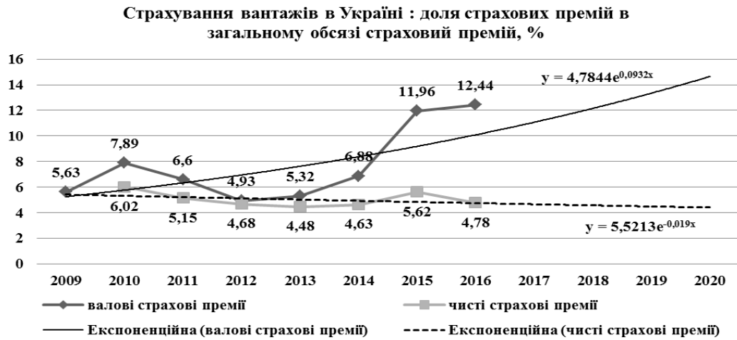
Рис. 2. Доля валових та чистих страхових премій за страхуванням вантажів в загальному обсязі страхових премій в Україні за 2009–2016рр.: динаміка та тренд Джерело: побудовано авторами на підставі [8–16].

Подальший аналіз динаміки валових та чистих страхових премій за страхуванням вантажів за 2009 р. – 9 кв. 2017 р., результати якого графічно представлено на рис. 3, підтверджує попереднє припущення.