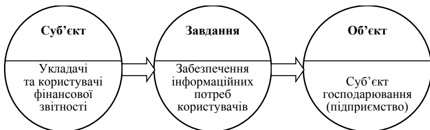
Рис. 2. Суб'єкт, об'єкт та завдання фінансової звітності

Разом з тим, як і будь-яка інформація, фінансова звітність має, по-перше, чітко визначені об'єкт, суб'єкт і сформульовані завдання, які суб'єкт ставить відносно даного об'єкта (рис. 2).