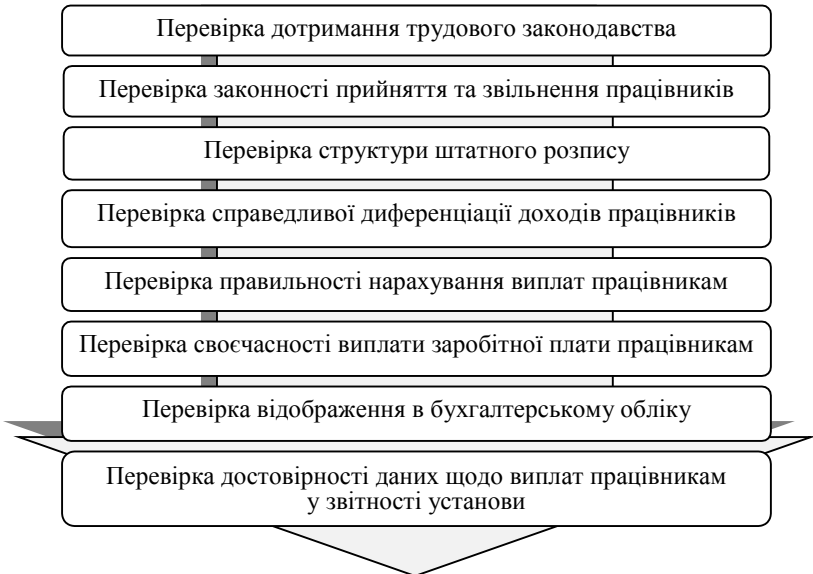
Рис. 1. Послідовність методики контролю виплат працівникам

Враховуючи досліджені літературні джерела, можна сформулювати послідовність єдиної методики контролю виплат працівникам бюджетних установ, яку розглядають більшість авторів (рис. 1).