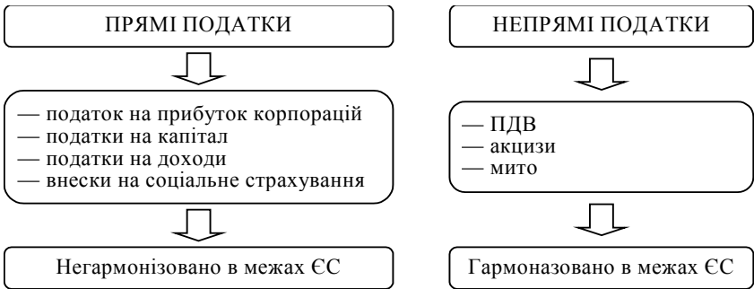
Рис. 2. Напрямки та стан гармонізації податків в межах ЄС

Саме з метою пом'якшення конкуренції в оподаткуванні у 70-х роках ХХ сторіччя було розпочато процес податкової гармонізації. З того часу вдалося доволі суттєво просунути у напрямку гармонізації непрямих податків, проте питання оподаткування доходів (прибутків) залишається відкритим. Перша директива на шляху гармонізації прямого оподаткування з'явилася у 1990 році (Директива 90/434/ЕСС) і стосується створення спільної системи оподаткування операцій, пов'язаних з об'єднанням, розподілом та трансфером активів, обміном акцій компаній з різних країн-членів ЄС. Директива 90/434/ЕСС запроваджує відстрочку по сплаті податків, які можуть бути нараховані на різницю між реальною вартістю активів та тією, що є основою для нарахування податків [6, Р. 0001—0005].