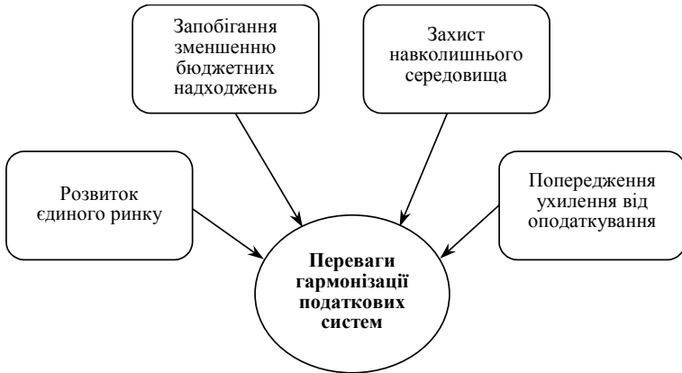
Рис. 1. Переваги, пов'язані з гармонізацією податкових систем країн ЄС

ткування. При цьому економічні втрати будуть тим більшими, чим вищою є мобільність факторів виробництва. Враховуючи можливість капіталу швидко змінювати місце свого «перебування», втрати є більшими ніж у випадку з фактором праця [3, Р. 30].