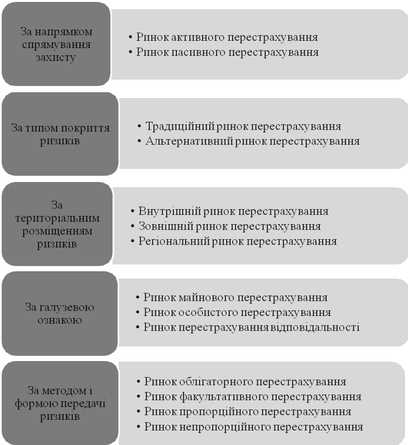
Рис. 2. Класифікація ринків перестраховання (розробка автора)

Дослідження поняття ринку перестраховання, його організаційних засад, класифікації сприяє: