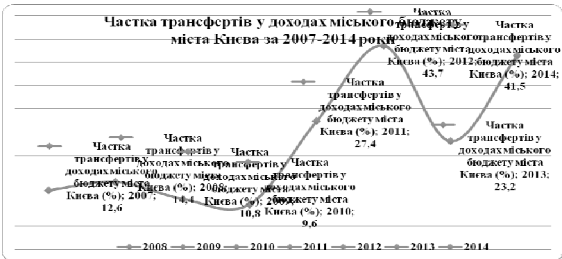
Рис. 1. Частка трансфертів у доходах міського бюджету міста Києва.

Питома частка трансфертів у доходах міського бюджету м. Києва за період з 2007 по 2014 роки також не носить однозначний характер. Перш за все, варто зауважити, що даний показник відображає пряму фінансову залежність бюджету міста Києва від державного, в процесі виконання повноважень покладених на місьцевий виконавчий орган. Тобто, чим вища питома вага трансфертів у структурі бюджету міста Києва, тим вища його залежність від фінансових ресурсів, що перераховує держава. Тому можемо констатувати значну залежність у фінансуванні бюджету міста Києва у 2012 та 2014 роках, де питома вага трансфертних платежів склала більше 40,0 %. На рис. 1 наочно відображено тенденцію змін питомої ваги частки трансфертів у структурі доходів міських бюджетів, що ілюструє раніше проведений аналіз.