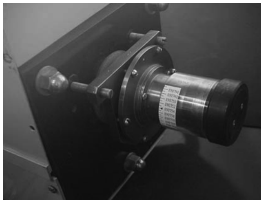
Рис. 2. Усовершенствованный механизм перемещения зеркала резонатора, установленный на юстировочном узле лазера

Поскольку в терагерцевых лазерах расстояние между продольными модами резонатора больше, чем естественная ширина лазерной линии, генерация возможна только при определенных дискретных длинах лазерного резонатора. Поэтому, кроме юстировки зеркал, требуется также точная настройка расстояния между ними. Для этого одно из зеркал снабжено специальным микрометрическим механизмом перемещения вдоль оси резонатора с точностью отсчета 1 мкм и диапазоном перемещения более 1 мм. Это дает возможность измерять длину волны излучения с точностью около 0,2 мкм (по расстоянию между десятью полуволнами). Усовершенствованный механизм перемещения (рис. 2) позволяет производить более прецизионную перестройку относительно центра линии (по суммарному набегу волны вдоль резонатора) [6].