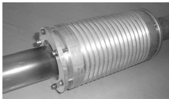
Рис. 3. Коаксиальный электрод системы накачки

Разработана также система накачки при помощи коаксиальных электродов [2]. Для возбуждения газового разряда в ней использованы два электрода, герметично установленных снаружи разрядной трубки (рис. 3).