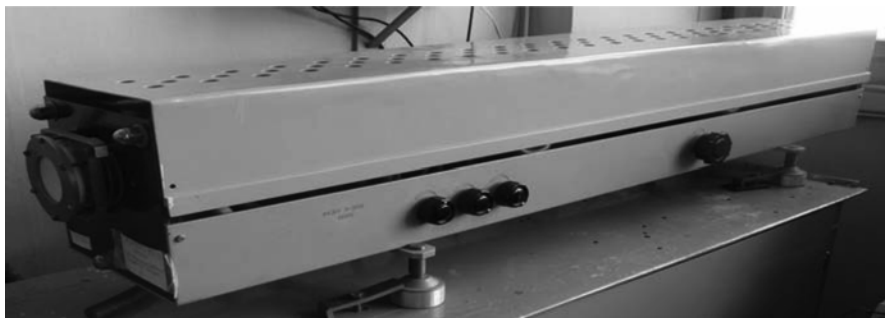
Рис. 1. Лазерный излучатель

Основу лазерной установки составляет газоразрядный лазерный излучатель (рис. 1), смонтированный в универсальном корпусе.