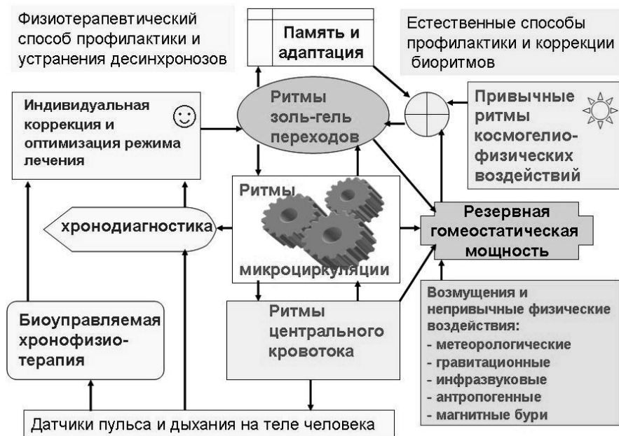
Рис. 2. Схема хронодиагностики, профилактики неблагоприятных реакций организма человека на непривычные внешние воздействия и устранения десинхронозов

Обычные способы физиотерапии не учитывают фазы биоритмов чувствительности и смещений