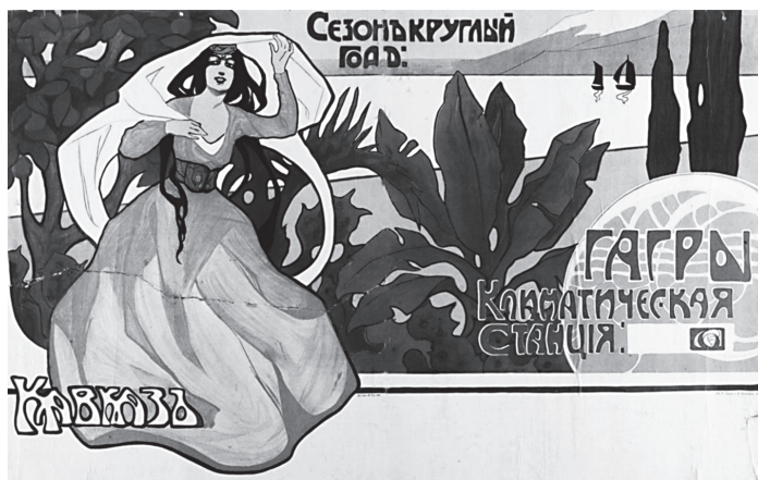
Рис. 4. Реклама Гагринской климатической станции в середине 1900-х гг.