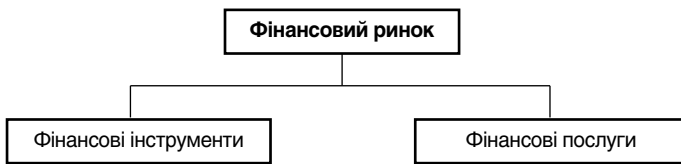
Рис. 2. Взаємозв’язок фінансового ринку і ринку фінансових послуг

Отже, взаємозв’язок фінансового ринку і ринку фінансових послуг можна проілюструвати такою схемою (рисунком 2).