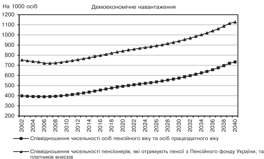
Рис. 1. Прогноз чисельності населення України за великими віковими групами, осіб

Також передбачається помітне зростання демоекономічного навантаження системи державного пенсійного забезпечення (за співвідношенням населення пенсійного й працездатного віку пенсіонерів і платників внесків до Пенсійного фонду України) практично протягом всього 40-річного періоду (рис. 2) за винятком досить короткого періоду до 2008 року. Однак очікується істотне прискорення цього зростання в 2030-х роках, коли й щорічні темпи приросту співвідношення пенсіонерів та платників внесків сягатимуть 2 %, і чисельність пенсіонерів, що