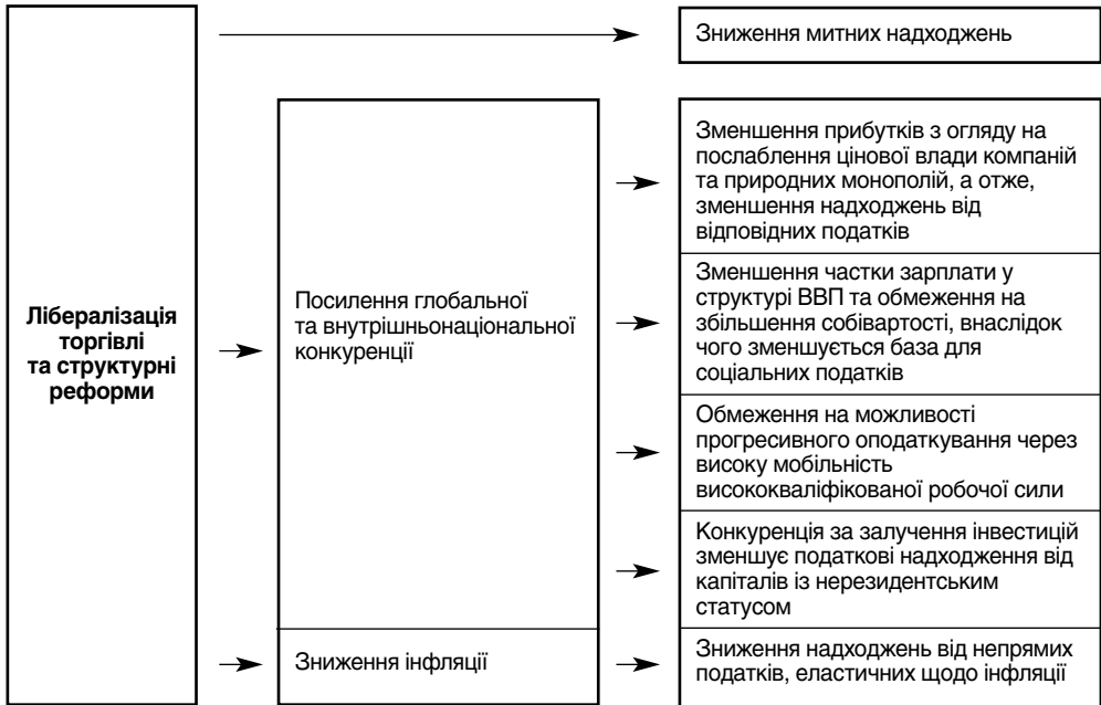
Рис. 1. Зв'язок між глобальною лібералізацією й дерегуляцією та проблемою “ерозії” фіскальної бази

даткових гаваней, а також зниження загального податкового навантаження тощо також руйнують податкову базу, особливо там, де співвідношення бюджету до ВВП перевищує середньосвітовий рівень. Реформування природних монополій, посилення нагляду за дотриманням умов конкуренції та приватизація змінили структурну картину функціонування економіки в цілому 15 . Детальніше канали зв'язку між глобалізацією та фіскальною політикою див. на рис. 1.