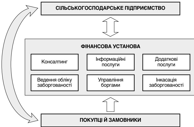
Рис. 3. Схема використання факторингу сільськогосподарським підприємством

Для України факторинг є досить новим фінансовим інструментом. Його поява і розвиток значною мірою пов'язані з постійним посиленням конкуренції на ринку товарів та послуг, удосконаленням форм і методів взаємодії між суб'єктами господарювання, споживачами та виробниками продукції.