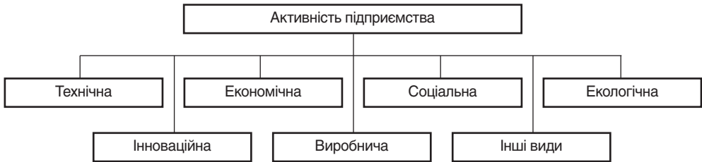
Рис. 1. Основні види активності підприємства

економічному словнику остання розкривається як дуже широке загальносуспільне поняття та визначається як посилена діяльність, діяльний стан 5 . Аналогічні підходи до тлумачення активності знаходимо в таких ґрунтовних працях, як Економічна енциклопедія та Великий тлумачний словник сучасної української мови 6 . Тобто активність є невід’ємною частиною діяльності. Тому в нашому випадку логічно й обґрунтовано говорити як про діяльність підприємства, так і про його активність, а отже і про її різновиди, зокрема економічну активність підприємства. На рис. 1 і 2 показано види активності підприємства та методологічні підходи до декомпозиції загальносуспільної категорії “активність”.