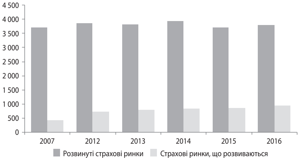
Рис. 3. Динаміка зібраних страхових платежів на розвинутих страхових ринках і тих, що розвиваються, у 2007, 2012–2016 рр., млрд дол. США

Слід зауважити, що стан світового страхового ринку є одним із зовнішніх факторів розвитку національних страхових ринків. Тому не менш важливо розглянути основні індикатори поступу останніх, зокрема проникнення (частку страхових платежів (СП) у ВВП) і щільність (СП на одну особу) страхування (табл. 2).