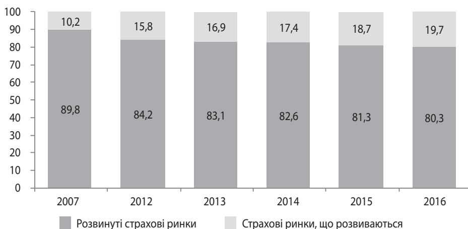
Рис. 1. Структура світового страхового ринку за рівнем розвитку ринків у 2007 р. та протягом 2012–2016 рр., %

Складено за: World Insurance in 2007: Emerging markets leading the way. Sigma . 2008. No. 3. URL: http://media.swissre.com/documents/sigma3_2008_en.pdf ; World Insurance in 2012: Progressing on the long and winding road to recovery. Sigma . 2013. No. 3. URL: http://media.swissre.com/documents/sigma3_2013_en.pdf ; World Insurance in 2013: Steering towards recovery. Sigma . 2014. No. 3. URL: http://media.swissre.com/documents/sigma3_2014_en.pdf ; World Insurance in 2014: Back to life. Sigma . 2015 No. 4. URL: http://media.swissre.com/documents/sigma4_2015_en.pdf ; World Insurance in 2015: Steady growth amid regional disparities. Sigma . 2016. No. 3. URL: http://media.swissre.com/documents/sigma_3_2016_en.pdf ; World Insurance in 2016: The China growth engine steams ahead. Sigma . 2017. No. 3. URL: http://media.swissre.com/documents/sigma3_2017_en.pdf .