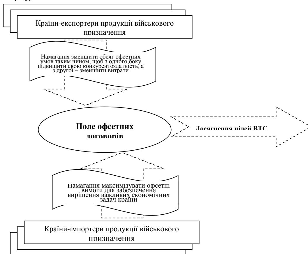
Рис. 1. Схема військово-технічного співробітництва в умовах офсету [складено автором з використанням [8]

Ліцензійне виробництво продукції передбачає передачу технологій за прямими комерційними угодами між виробником країни-експортера і урядом або виробником країни -імпортера. Головна різниця між спільним і ліцензійним виробництвом полягає в розподілі авторських прав на продукцію і обмежень по використанню виготовленої продукції. Прикладами таких угод можуть бути виробництво літаків F-16 у Туреччині на основі ліцензій з США.