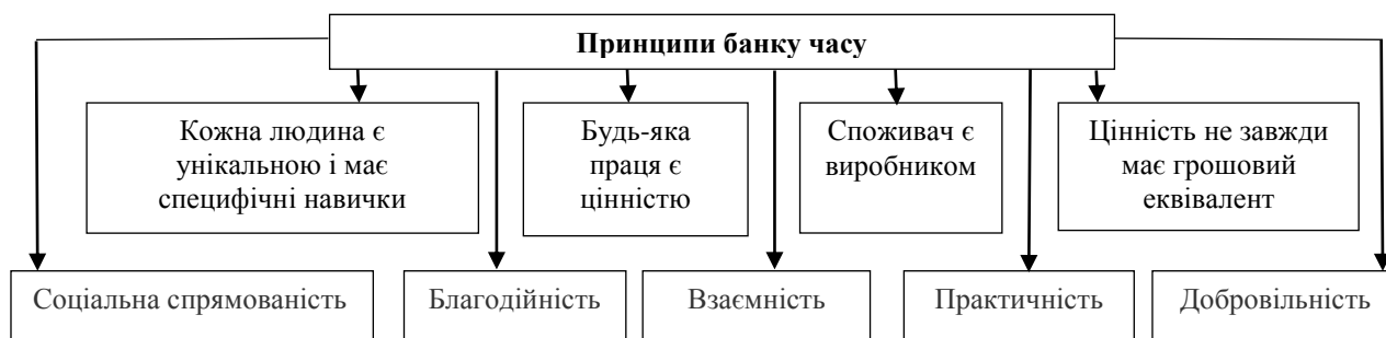
Рис. 1. Принципи створення й функціонування банку часу

нерівного доступу до базових товарів та послуг, соціальних труднощів і забезпечити відродження місцевих громад (communities). Основні принципи банку часу можна представити в такий спосіб (рис. 1).