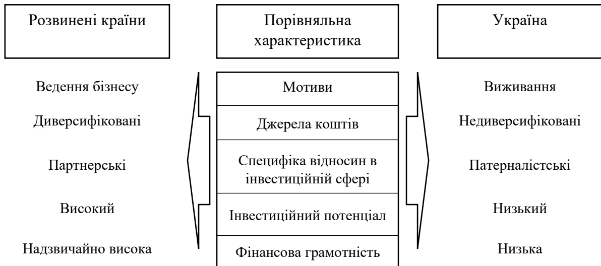
Рисунок 3 - Аналіз інвестиційної поведінки домогосподарств Сформовано автором на основі [5]

Поміж інших напрямів інвестування вільних коштів населення, крім депозитів, варто виділити малий бізнес або приватне підприємництво та нерухомість, разом із прибутком від оренди. Частіше за все, така діяльність існує за рахунок оформлення кредитів (іпотечного кредиту) з урахуванням ризику проекту. Банки також долучаються до акумуляції коштів населення і пропонують великий спектр продуктів і послуг, як то: операції з державними цінними паперами, операції з корпоративними облігаціями, муніципальними облігаціями та облігаціями банків; операції з векселями; операції з акціями [6]. Проте, ринок цінних паперів в Україні на разі стримується недосконалістю, нестабільністю та суперечливістю законодавчої бази, яка регулює його та суттєвими бюрократичними бар'єрами започаткування та провадження інвестиційної діяльності із цінними паперами. Крім того, дохід від такої діяльності часто не покриває потенційні ризики, які можуть виникнути в умовах нестабільної економічної ситуації.