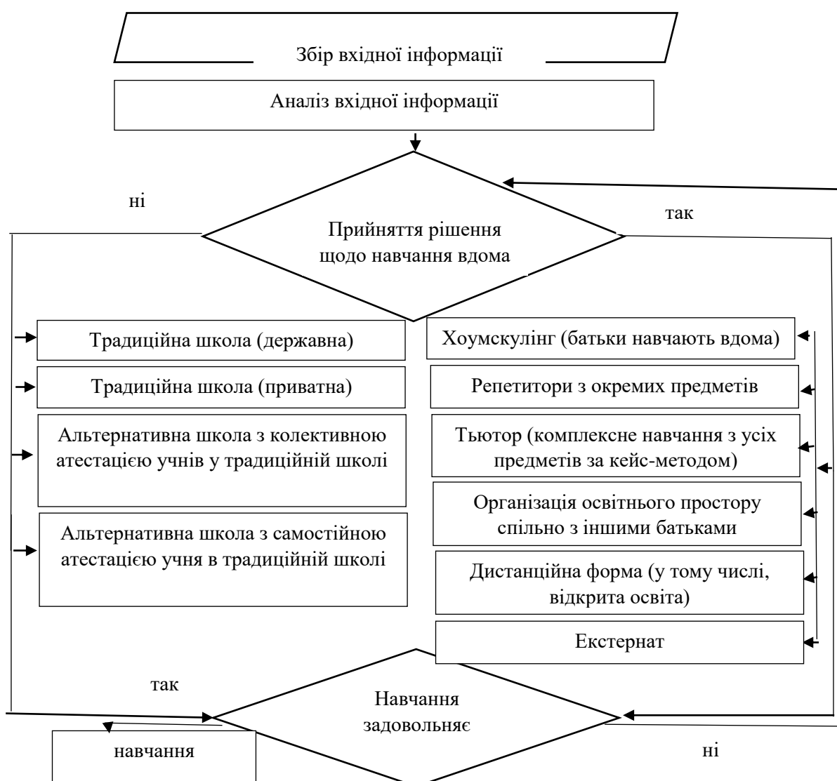
Рисунок 2 – Алгоритм прийняття рішення про перехід на домашнє навчання (хоумскулінг)

Таким чином, враховуючи ці ознаки, а також в умовах дефіциту інформації стосовно юридичних та організаційних питань, батьки знаходяться в інформаційному вакуумі щодо процесу переходу дитини на домашнє навчання (хоумскулінг). На рис. 2 запропоновано алгоритм прийняття рішення про переведення дитини на домашнє навчання (хоумскулінг).