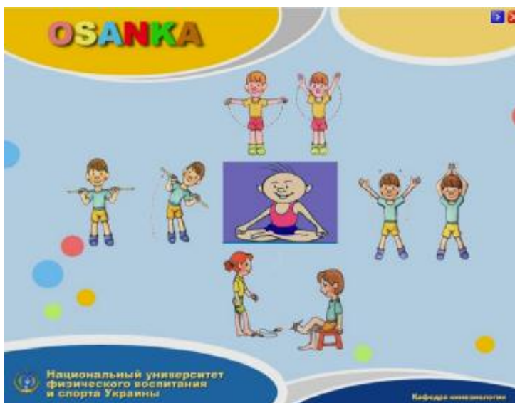
Рис. 1. Главное окно программы "Osanka" (распечатка с экрана компьютера)

На панели рабочего окна расположены следующие вкладки: