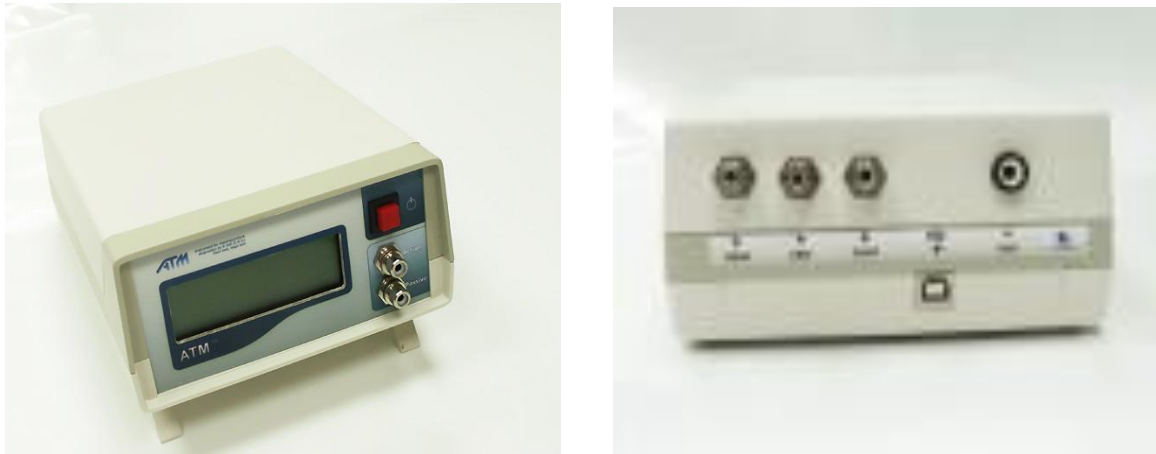
Рис. 5. Система ATM "VEGA-Test"

Система автоматично визначає органи-мішені, на які необхідно звернути увагу. На підставі інтегрального аналізу 30-ти показників можливе прогнозування ризику виникнення захворювань, здійснення їх ранньої діагностики, оцінки умов розвитку патології. Система ATM "VEGA-Test" забезпечує керування функціями за допомогою комп'ютера, можливість багаторазового зняття інформації, не вводячи похибки в контур система – людина, автоматичне калібрування протягом декількох секунд, перевірку цілісності ланцюгів і контакту електродів із тілом людини, інтегровану систему автоматичного контролю й знімання інформації.