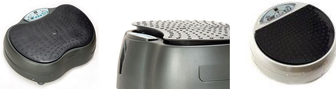
Рис. 1. Тренажер-віброплатформа ViaGym

Естетичний вплив підвищує тонус м'язів, тренованість, інтенсивну антицелюлітну дію, формує фігуру, покращує стан і тонус шкіри, поставу. Тренування на апараті можна використовувати як частину розминки перед тренуванням (розігрівання м'язів), під час тренування (сприяння виведенню шлаків з організму) і після значних фізичних навантажень для відновлення організму й зняття втоми. Тренуючись на апараті, доцільно виконувати вправи по чергово для різних груп м'язів – для верхньої та нижньої частин тіла й черевного преса, для надання відпочинку кожній групі м'язів. Оскільки під час фізичного навантаження (оптимум 10 хв) активізується лімфосистема та організм утрачає рідину, слід за 0,5 години до тренування пити воду. Вплив апарата на організм ґрунтується на горизонтально рухомій вібрації, яка імітує рухи людини під час ходьби й стимулює всі тканини тіла, при цьому виникає відчуття, ніби тисячі мікроскопічних валиків масажують тіло від стоп до шиї.