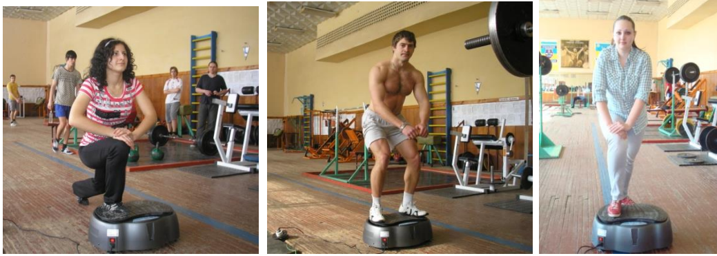
Рис. 3. Фізичні вправи на віброплатформі ViaGym (під час попередніх досліджень)

Усі учасники позитивно оцінили застосування тренажера і свій психоемоційний стан після тренування; аналіз загального самопочуття оцінено у 8–10 балів; стан втоми – у 1–2 бали. ЧСС після тренування підвищилась на (2–12 уд./хв) – 21 випадок, ЧСС після тренування знизилася на (1–10 уд./хв) – шість випадків. Значення АТ після тренування підвищилося (сист. і діаст.) на (10–25 / 2–20 пунктів) – 22 випадки, АТ після тренування – знизилося на (3–22 / 2–21 пункт) – три випадки. Застосування віброплатформи ViaGym забезпечує підвищення якості та ефективності тренування, швидке відновлення людини після навантажень, зменшує стрес, прискорює процес спалювання жиру, покращує обмін речовин і кровообіг кровоносних судин, укріплює суглоби нижніх кінцівок і підвищує тонус м'язів.