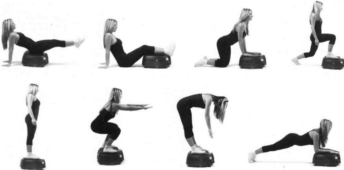
Рис. 2. Фізичні вправи на віброплатформі ViaGym

Деякі фізичні вправи на віброплатформі ViaGym (рис. 2). Вправи для всього тіла – стоячи на віброповерхні, ноги паралельно на ширині плечей. Позиція стоячи на напівзігнутих ногах . Позиція згинаючи верхню половину тулуба – руки на ширині плечей. Позиція з нахилом тулуба вперед – ноги ширше плечей, руками спиратися на віброповерхню. Позиція для тренування нижньої частини ніг – нижня частина ніг перебуває паралельно на віброповерхні, тіло утримується руками, поміщеними за спиною. Позиція сидячи – сідниці на віброповерхні.