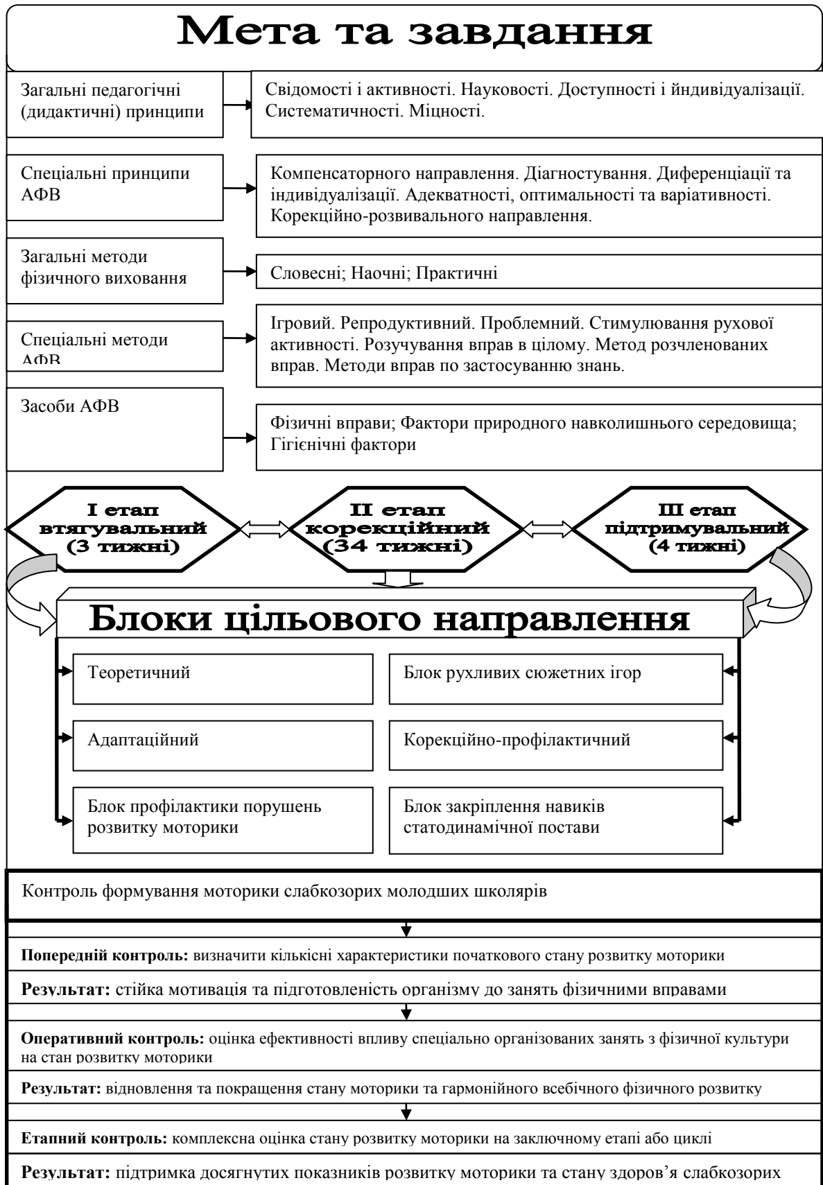
Рис. 1. Блок-схема програми формування моторики дітей молодшого шкільного віку з послабленим зором